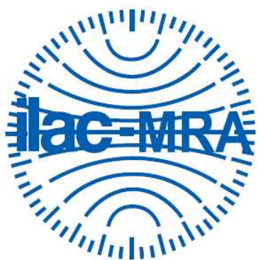
그림 1. 국제공인시험기관 인정 마크